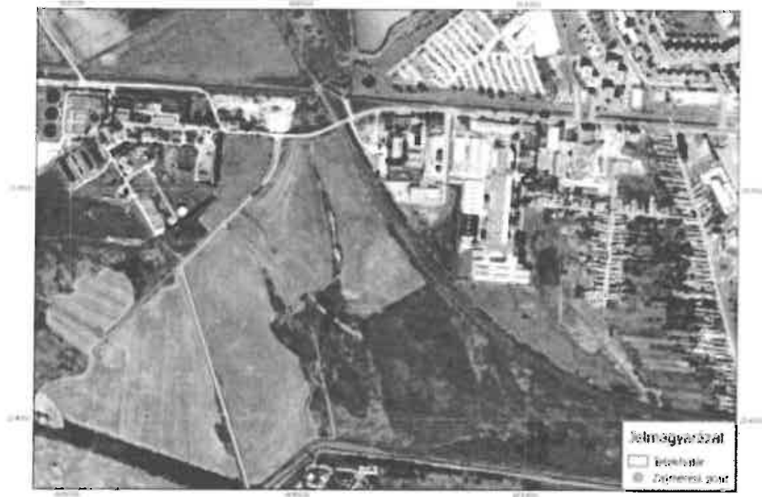
2. ábra: Mérési pontok

A mérési pontok pontos helyét az alábbi táblázatban foglaljuk össze: